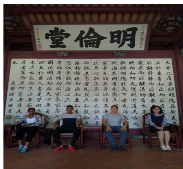
圖5：認識孔子教育理念(台南孔廟)