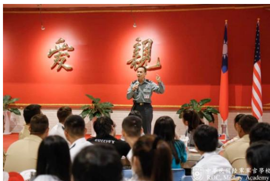
圖8：參訪陸軍官校(校長致詞)