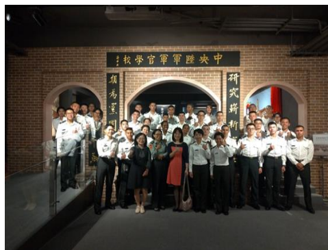
圖7：參訪陸軍官校(校史館內)