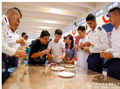
圖9：分組包水餃活動(北餐廳)