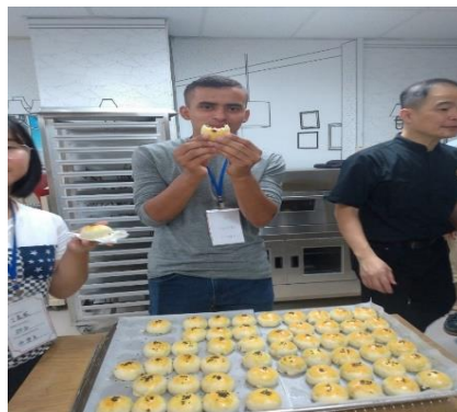
圖3：製作中秋月餅(蛋黃酥)