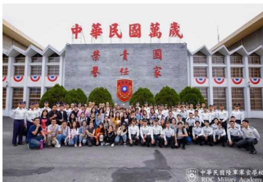
圖6：參訪陸軍官校(校史館大門)